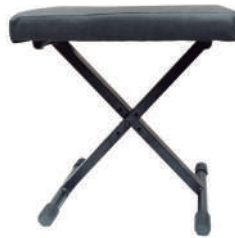
//BT-200// Banqueta em X desmontável para teclado. Reforçada, com 3 estágios de regulagem.