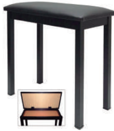
//BO-20C// Banco montado para órgão com compartimento.