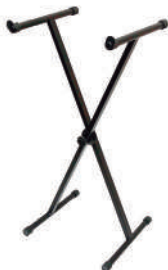
//2010// Suporte em X para 1 teclado 30x20.