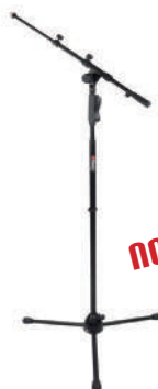
//PMG-100// Pedestal girafa para 1 microfone telescópico. Sistema de regulagem automático.