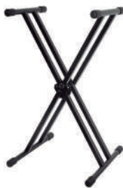
//2040// Suporte 2 X para 1 Teclado 25x25 sistema Lock Memory.