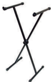
//2020// Suporte em X para 1 teclado 20x20.