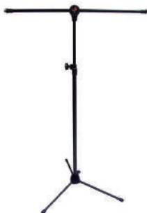
//PMG-20// Pedestal girafa para 2 microfones.