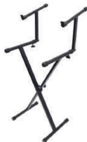
//2030// Suporte em X para 2 teclados 40x20.