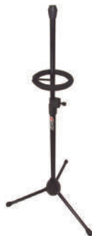
//5700-TB// Suporte para trombone.