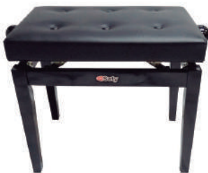
//BP-80// Banco Luxo para piano em madeira com estofamento especial. Regulagem de altura.