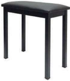
//BO-20// Banco montado para órgão.