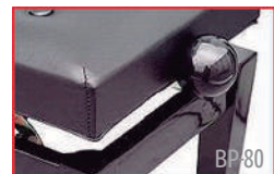
Em detalhe, regulagem de altura.