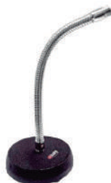
//PMS-04// Pedestal de microfone de mesa com haste cromada flexível de 30cm e base de 12cm.