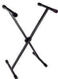
//2045// Suporte em X para 1 teclado 25x25 sistema Lock Memory.