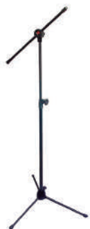
//PMG-10// Pedestal girafa para 1 microfone.