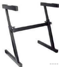
//SZ-02// Suporte em Z para 1 Teclado. Desmontável. Regulagem de altura.