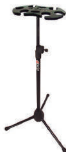
//PM-06// Pedestal descanso para 6 microfones. Regulagem de altura.