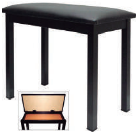
//BP-20C// Banco montado para piano e teclado com compartimento.