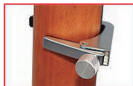
Detalhe dos modelos CT-250 e CT-200