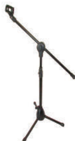
//PMG-07// Pedestal girafa mini para amplificadores e bumbo.