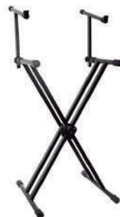
//2050// Suporte 2 X para 2 Teclados 25x25 Ajuste de altura / Lock Memory.