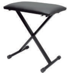
//BT-10 // Banqueta em X desmontável para teclado. Com 2 estágios de regulagem.