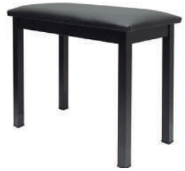
//BP-20// Banco montado para piano e teclado.