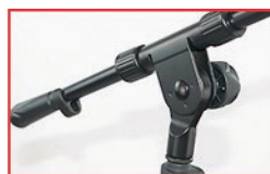
Detalhes do PMG-100.