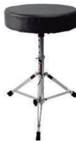
//BB-100// Banco para bateria com regulagem de altura e ferragem dupla. Assento confortável.