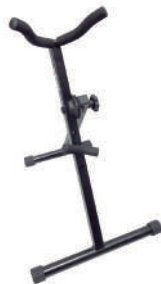
//5000// Suporte para sax alto e tenor.