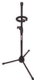
//5600-TR // Suporte para trompete.