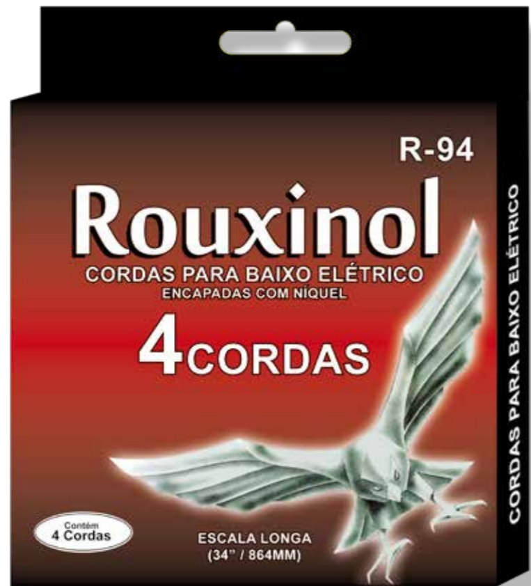
R-94 | CORDAS PARA BAIXO | 4 CORDAS