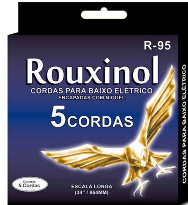
R-95 | CORDAS PARA BAIXO | 5 CORDAS